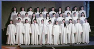
■合唱／NHK熊本児童合唱団