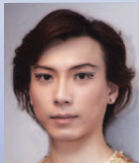
■ドロッセルマイヤー ホワン カイ