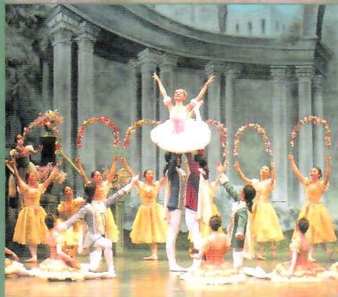
熊本バレエ劇場 30 年記念特別公演 2005 《眠れる森の美女》のステージより