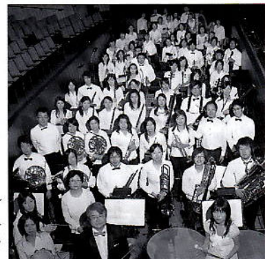
■演奏/ 熊本ユースシンフォニー オーケストラ