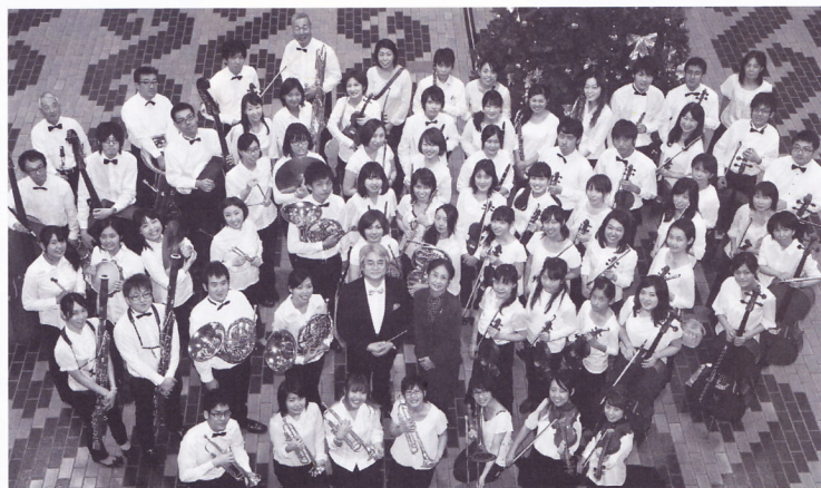
熊本ユースシンフォニーオーケストラ